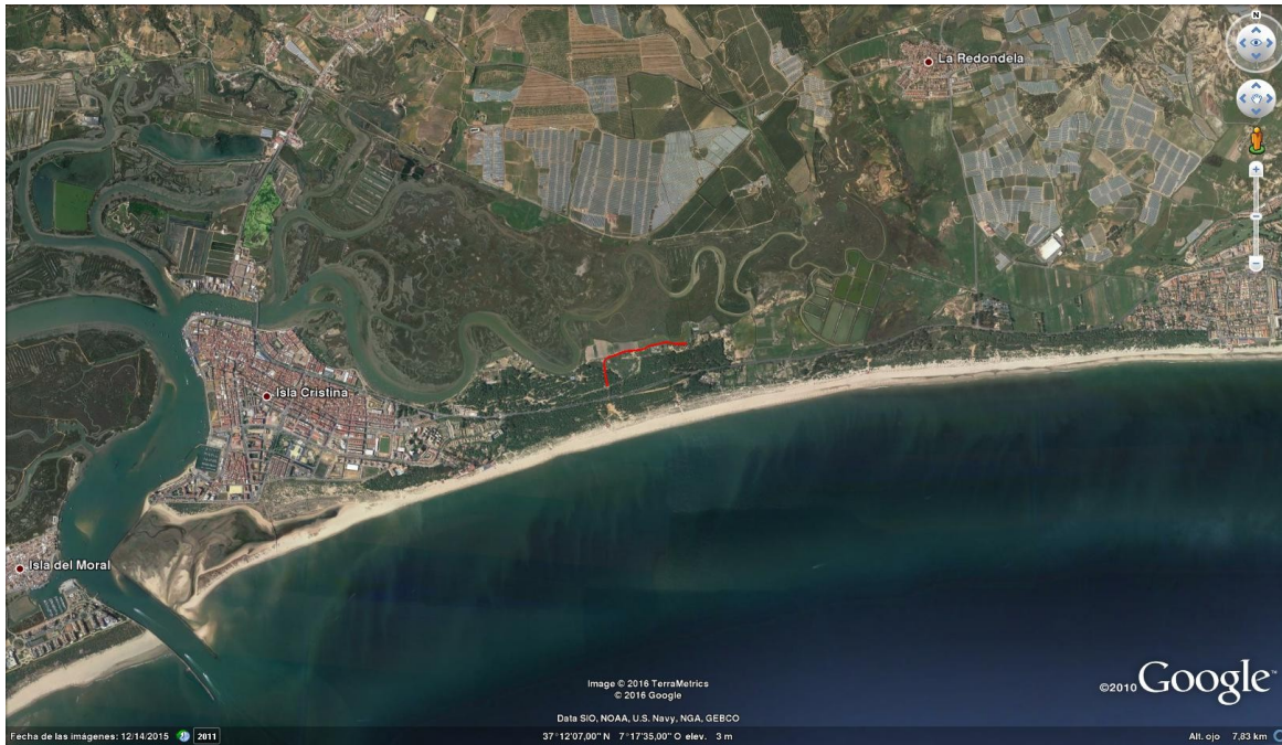
Fig. 4 . Localización del recorrido sujeto a tratamientos espaciales (trazo de línea roja).

A partir de los ciclos de inundación mareal, las alturas máximas alcanzadas por las pleamares, y en base a la fenología de las poblaciones de la especie Oc. caspius (la presencia de Oc. detritus puede considerarse despreciable), se prevén para 2025 los siguientes periodos de riesgo por presencia masiva de adultos (Tabla 1). Debido a la imposibilidad de anticipar la cuantía y frecuencia de las precipitaciones no se contempla una posible estimación del riesgo de picos de adultos como consecuencia de estas.