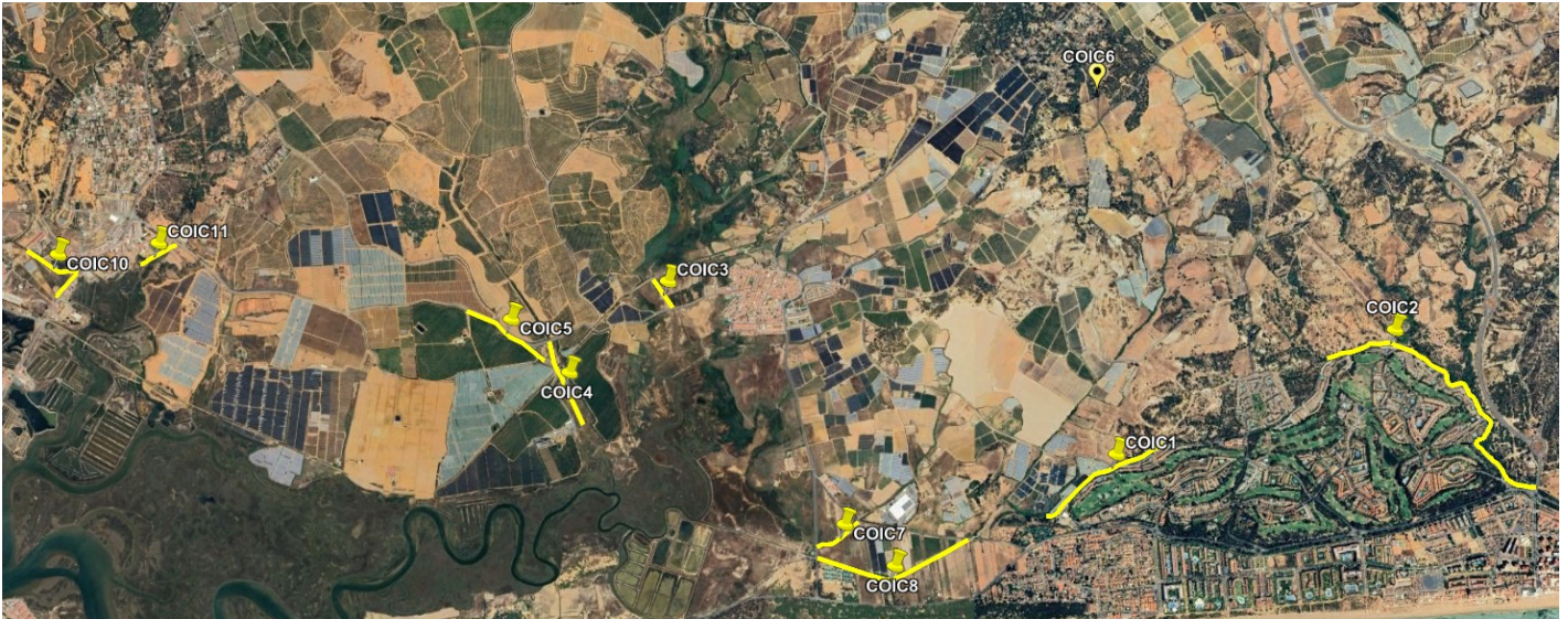
Tabla 1. Relación zonas de tratamientos de Puntos “C”.

Fig. 3. Distribución de las puntos o zonas de tratamientos antilárvicos en focos de cría de especies del género Culex spp.